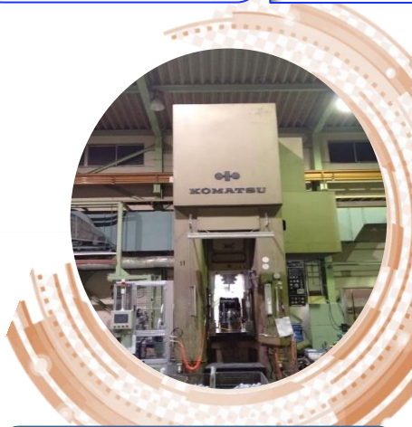
KOMATSU製 400t (L1C400L)

2020年、弊社では” ロングストローク ” 機械式プレス機を新たに導入しました。